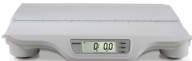
Figura 1-1. Báscula Digital de Infante RL-DBS

Puede encontrar manuales y recursos adicionales en el Rice Lake Weighing Systems sitio web www.ricelake.com/health