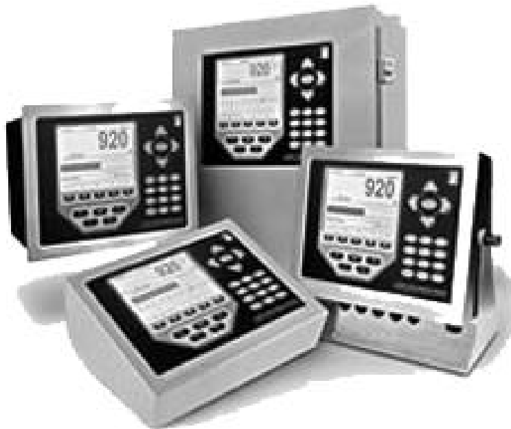
Typical models 820i-xy and 920i-xy / Modèles typiques 820i-xy et 920i-xy