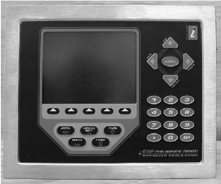
Typical display for model 920i-xy/ Affichage typique du modèle 920i-xy