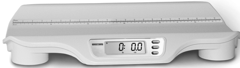
Figura 1-1. Báscula Digital de Bebés RL-DBS

Se puede ver o descargar este manual del sitio web de Rice Lake Weighing Systems al www.ricelake.com/health . Rice Lake Weighing Systems es una compañía registrada ISO 9001.