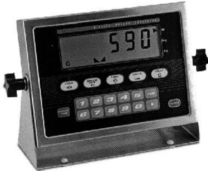
Model / Modèle IQ+590