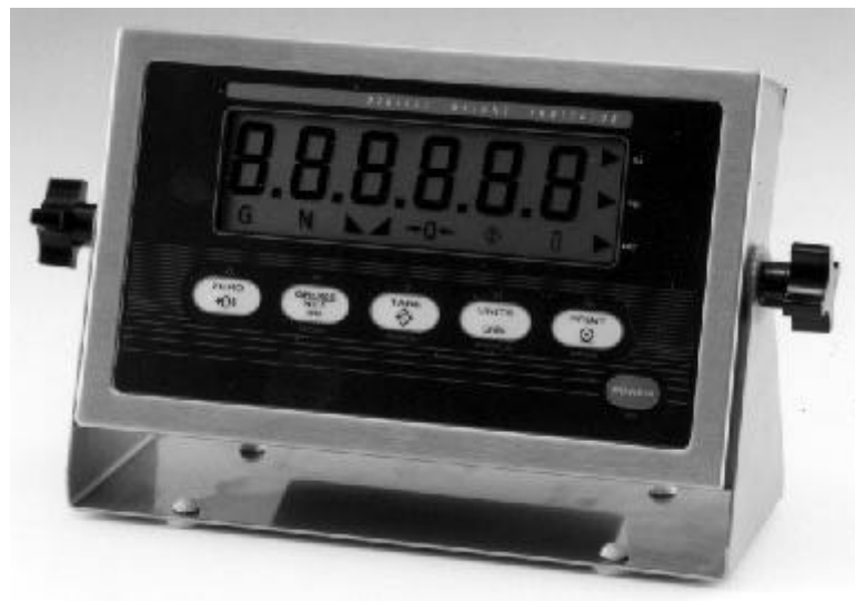
Model / Modèle IQ+390