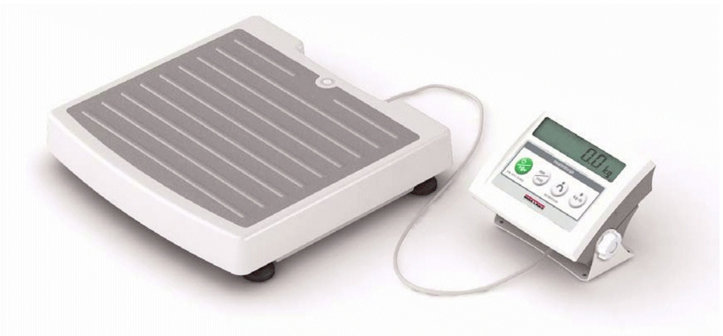
Typical Model 140-10-7N / Modèle typique 140-10-7N