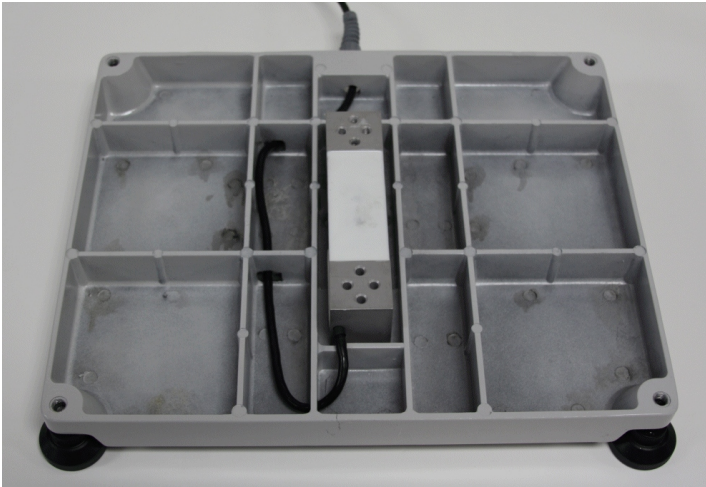
Typical Model 140-10-7N (without platter) / Modèle typique 140-10-7N (sans plateau)