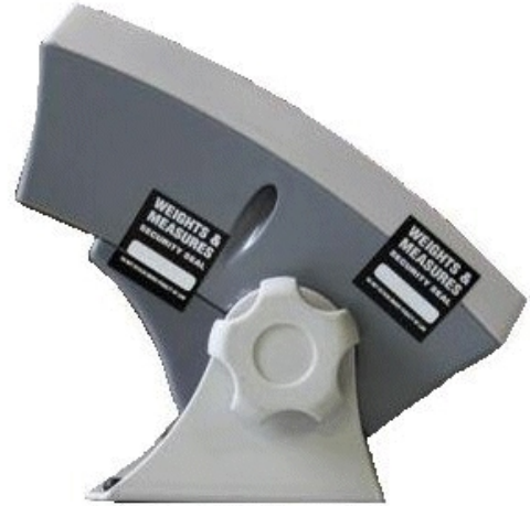
Typical Seal Locations / Emplacement typique des scellés